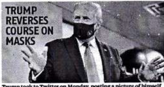
Trump took to Twitter on Monday, posting a picture of himself wearing a mask and calling the act "patriotic"

THE US House of Representatives has unanimously passed an amendment to the National Defense Authorization Act (NDAA), slamming China's aggression against India in the Galwan Valley and its growing territorial assertiveness in and around disputed areas like the South China Sea.